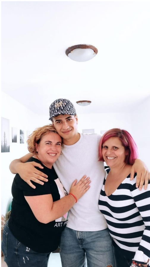
Las despedidas no son siempre tristes